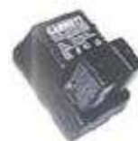
Ładowarka z akumulatorem